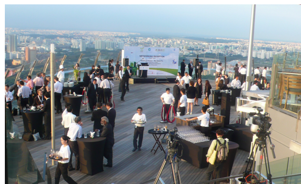
Openingsplechtigheid 23 juni 2010